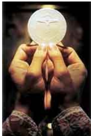
“La hostia católico-romana”

Para los verdaderos cristianos, la Santa Cena que tomamos según el entendimiento que nos aporta la Palabra de Dios, nada tiene que ver con la comunión católico romana, es decir, con la misa.