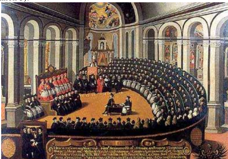
“ El Concilio de Trento ”

« Si alguien niega que en el sacramento de la Santísima Eucaristía están presentes verdadera, real y substancialmente el cuerpo y la sangre y la divinidad de nuestro Señor Jesucristo, y consecuentemente Cristo mismo, sino que dice que es sólo un símbolo, figura o fuerza, sea anatema » (es decir, sea maldito). Sigue diciendo Trento: « Si alguien niega que en el venerable sacramento de la Eucaristía el Cristo integral está contenido bajo cada forma y bajo cada parte de cada forma cuando se divide, sea anatema » (canon 3).