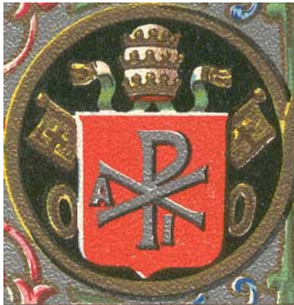
El escudo del papa San Gelasio I

Esta declaración se opone a la posterior doctrina papal de la transustanciación.