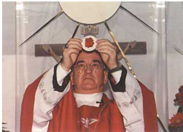
“Elevación de la hostia romana”

La elevación y adoración de la hostia se estableció en el año 1217. Todo esto no había ocurrido nunca antes en la historia del catolicismo, menos todavía del cristianismo, porque la Palabra de Dios prohíbe la adoración de imágenes, objetos y sustancias. En el año 1550, como respuesta a la Reforma, el Concilio de Trento reafirmó la adoración de la hostia y confirmó la doctrina de los siete sacramentos.