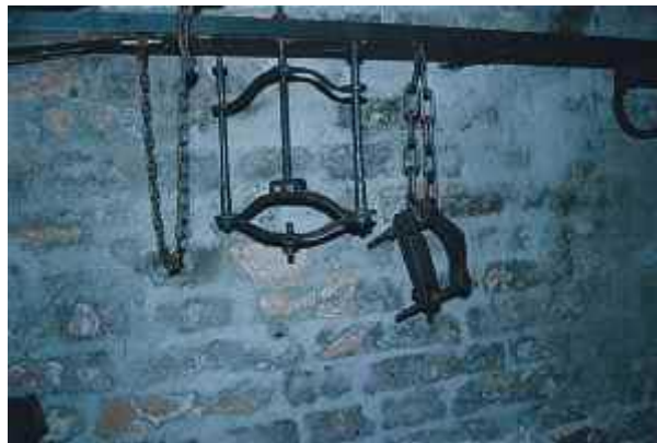
“Algunos de los instrumentos de tortura que fueron aplicados a los Albigenses por mandato expreso del papa Inocencio III, que de inocente tenía bien poco”

transubstanciación como dogma de fe, es el mismo que mandó asesinar a miles de personas en el sur de Francia: los Albigenses.