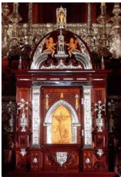
“El sagrario católico romano”

<<¿O ignoráis que vuestro cuerpo es templo del Espíritu Santo, el cual está en vosotros, el cual tenéis de Dios...?>> (1 Corintios 6:19) ¡Los cristianos sí somos el verdadero sagrario !