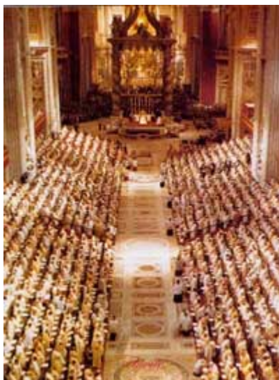
Concilio Vaticano II

Nótese que un hombre, el cual se presenta ante Dios y ante los demás como un sacerdote, cuantas veces quiere vuelve a sacrificar a Jesucristo. Por este procedimiento, según Roma el Cristo vivo queda en las manos de los hombres, y éstos hacen con Él como quieren y cuando quieren... ¿Tanto cuesta darse cuenta de tamaña aberración?