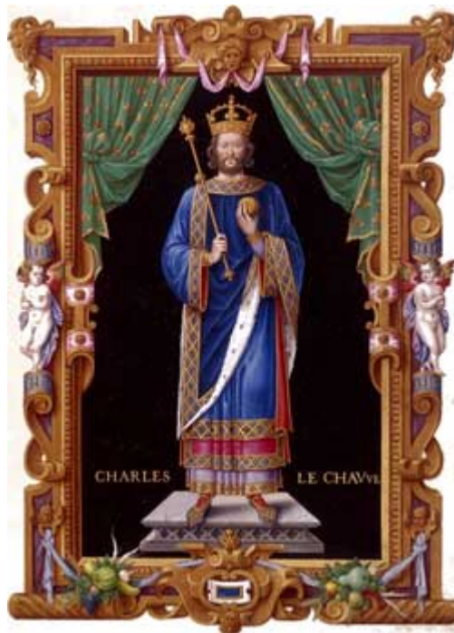
El rey franco Carlos el Calvo

Carlos el Calvo, a la sazón rey de los francos, leyó el tratado de Radberto y tuvo dudas de lo que en él se decía, por ello le pidió aclaraciones al monje Ratrammo de Corbie. Este le contestó que el cuerpo eucarístico no es el cuerpo histórico de Jesús, que se encuentra en el cielo a la diestra del Padre. Esta es otra evidencia clara e histórica de que en aquella época, la Iglesia de Roma no enseñaba la doctrina de la transustanciación todavía.