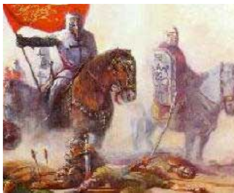
“Las sangrientas e inhumanas Cruzadas Papales”

La doctrina de la transubstanciación , asegura que el pan y el vino, una vez consagrados por el sacerdote romano, son literalmente el cuerpo y la sangre de Cristo. Esta doctrina fue sancionada por primera vez en el Concilio romano de Tours, en el año 1059. Se promulga definitivamente dicha doctrina y viene a ser dogma en el IV Concilio de Letrán, en una fecha tan tardía como la de 1215, en pleno apogeo de las Cruzadas.