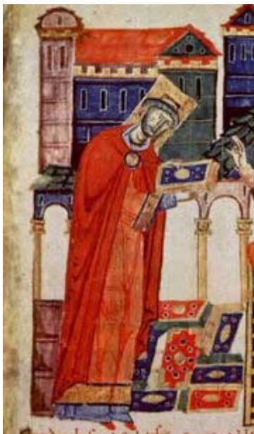
“Representación del papa Víctor III, que murió envenenado al tomar la hostia consagrada”

Es público y notorio que muchas personas han sido asesinadas por la hostia y el vino consagrado, por haberse puesto en ellos veneno. Enrique VIII, por ejemplo, murió por haber tomado una hostia envenenada. El papa Víctor III (1088) murió por haber bebido en la misa de un cáliz envenenado. Esto prueba que aquellos elementos no se habían convertido en el cuerpo de Cristo; porque, ¿quién afirmaría que el cuerpo de Cristo puede envenenar a alguien?