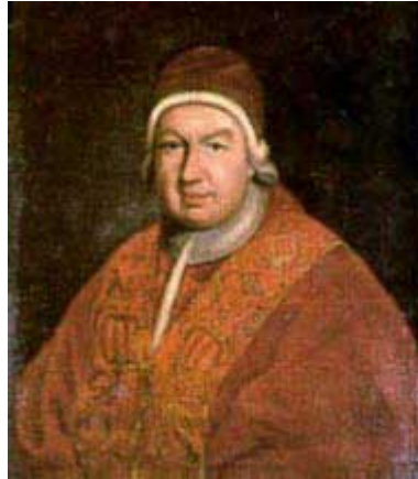
El papa Benedicto XIV

que sabe es que no es de origen apostólico. El Evangelio y las Epístolas fueron introducidas por Jerónimo. El << Credo >> de Constantinopla fue introducido en el siglo XI. El << Ofertorio >> no había sido incluido todavía en el siglo X. Con respecto al << Canon >>, Gregorio I dice que, a excepción de las palabras de la consagración que fueron dichas por Cristo, el resto fue compuesto en el siglo V.