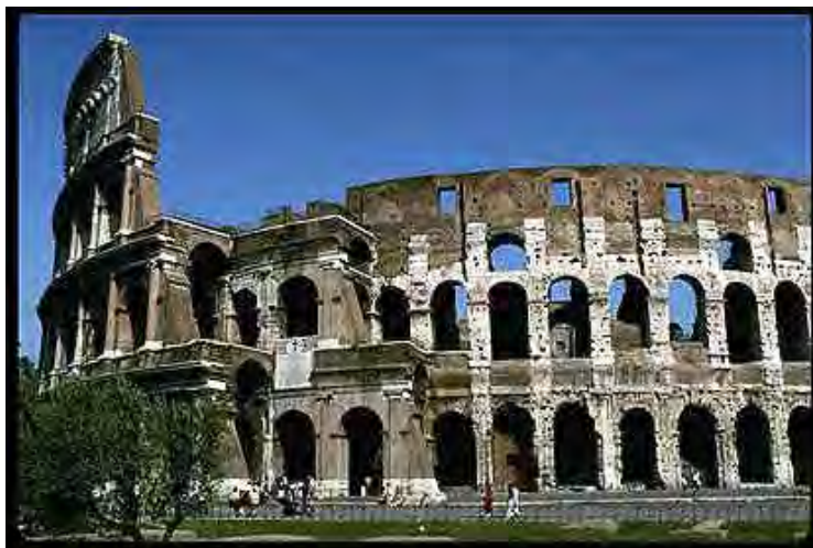
Ruinas del Coliseo romano, construido con el oro sustraído del templo de Jerusalén

vestales, y de la plebe. Esa maldición, fue en parte el resultado del adulterio espiritual de los judíos, y del rechazo de su Mesías (Lc. 21: 20-24)