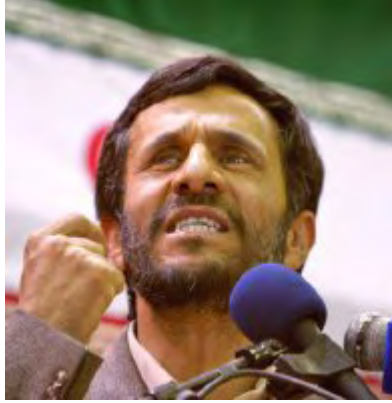
Mahmud Ahmadinejad, actual presidente de la República Islámica de Irán

No es de extrañar entonces, que Dios haya permitido una señal tan clara como la aludida al inicio de este artículo. Para mí, no cabe la menor de las dudas, ¡Dios no ha terminado con Israel! El Señor va a seguir con lo que empezó hasta su bienaventurada conclusión.