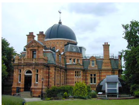
Greenwich Royal Observatory

Como todos sabemos, los seis puntos destacados por Gabriel (leer vers. 24) no se han cumplido todos sobre Israel y Jerusalén todavía. Podemos asegurar que la última semana de años que todavía no se ha cumplido, es la expresión pura de la misericordia de Dios sobre Israel, y la prueba indubitable de que la llamada “teología del Reemplazo”, la que enseña que todo lo referente a Israel pasó a la Iglesia y que Dios ya abandonó definitivamente a Su pueblo, es del todo falsa y absolutamente refutable.