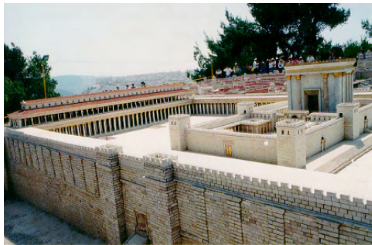
Complejo del Templo

Ese decreto ordenante fue dado de acorde a Nehemías 2: 1 y ss., en el mes de Nisán del año vigésimo de su reinado. El primero de Nisán del año veinte del rey Artajerjes fue calculado por el Observatorio Real de Greenwich, en el Reino Unido, como el 14 de Marzo del 445 antes de Cristo. Así pues, ya sabemos el momento de inicio de esos 490 años o Setenta Shabuim .