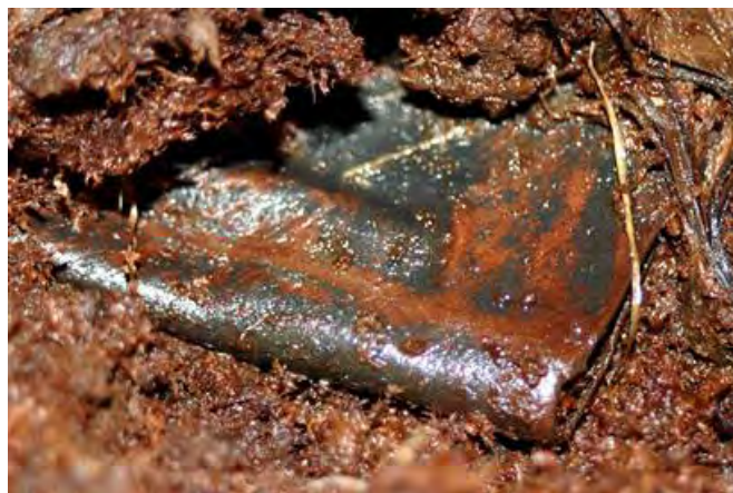
El manuscrito en cuestión, en el lugar donde fue hallado

El artículo seguía diciendo, <<el libro de aproximadamente 20 páginas, ha sido fechado hacia el año 800-1000. Bernard Meehan, experto en manuscritos del Trinity College, dijo que ese era el primer descubrimiento en dos siglos de un documento perteneciente al principio del medioevo en Irlanda>> (2)