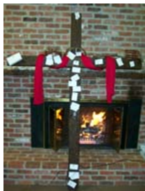
Foto de la cruz, con las "hojas clínicas" clavadas, realizada durante un encuentro del G12

Fíjense bien: Los pecados son clavados en una cruz, en una cruz tangible, moderna, en una cruz que no es la de Cristo... ¡ en una falsa cruz!