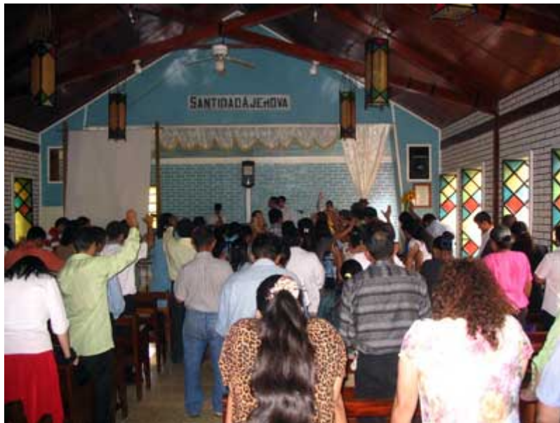
“Ministrando al finalizar el Simposio matinal”

Lo sintomático, es que muchos son seducidos y engañados con esa falacia, incluso creyentes de años en el Evangelio, incluidos ministros, los cuales aseguran que sólo a partir del “Encuentro” han nacido de nuevo, anulando con esa declaración todos los años anteriores de servicio y entrega a Cristo.