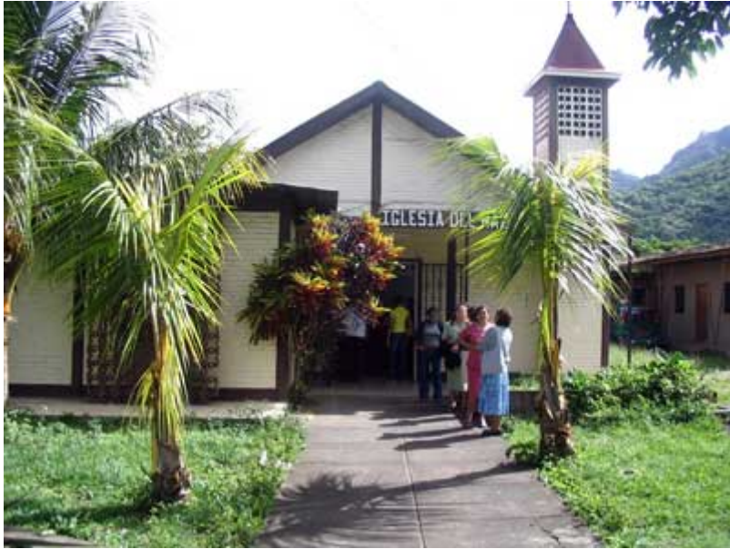
"La Iglesia del Nazareno en Jinotega, Nicaragua"