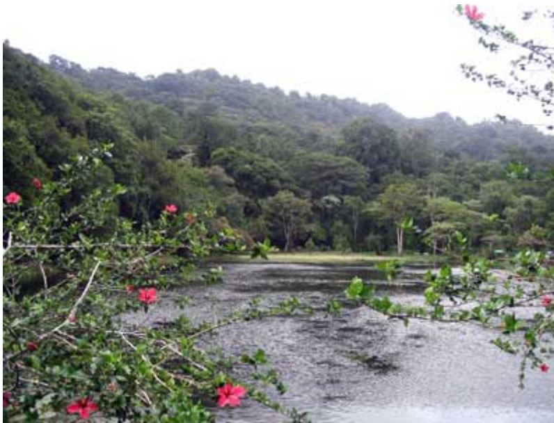
“La “Selva Negra”, cerca de Jinotega (Nicaragua)”

Fatigado, pero dichoso por haber cumplido con los objetivos, regresé hace pocos días de un largo viaje; de un largo periplo que me llevó hasta las lejanas y verdes tierras de Nicaragua, en Centroamérica.