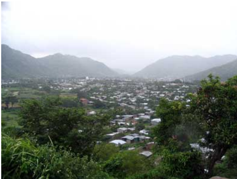
“Jinotega, capital del Departamento del mismo nombre”