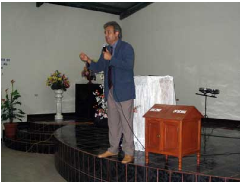
“En el Simposio por la tarde en la Iglesia Tabernáculo Peniel”

Con el templo casi lleno, seguimos con el estudio acerca de la realidad del G12. Empecé disertando acerca de la errónea interpretación del concepto de líder (ver artículos en nuestra página web). También acerca de la tendencia a endiosar a los líderes de líderes, como a los Castellanos, Cash Luna, etc. Diversos testimonios fueron dados al respecto. (ver artículos en nuestra página web www.centrorey.org ).