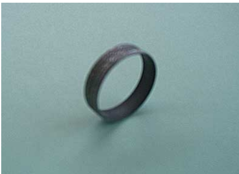
“El anillo de “casado con Cristo”