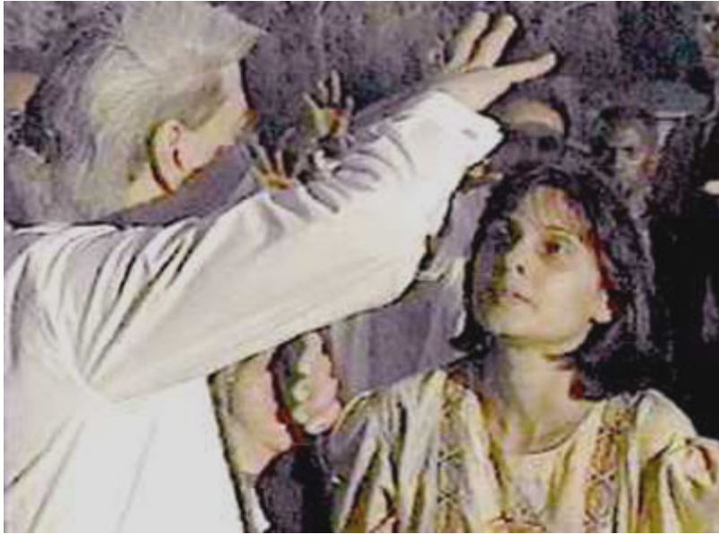
“Tofik Benedictus “Benny” Hinn tumbando a los creyentes por el piso”