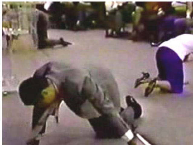
“Borrachos en el espíritu”

Pero, veamos en qué pretenden basarse bíblicamente a la hora de defender su credo al respecto.