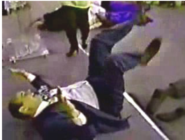
“El vergonzoso “santo” revuelco”

El asunto es más serio de lo que a priori nos pudiera parecer, y requiere de un suficiente análisis por nuestra parte, ya que muchos, muchos legítimos hijos de Dios hoy en día, están siendo engañados y seducidos por hombres y mujeres que haciendo estas cosas, aun se atreven a tacharnos a los que nos oponemos, de fariseos, religiosos, legalistas, faltos de fe, de ser seguidores de la “teología de la resignación” (en cuanto a que nos resignamos a no ver nada “nuevo” de parte de Dios).