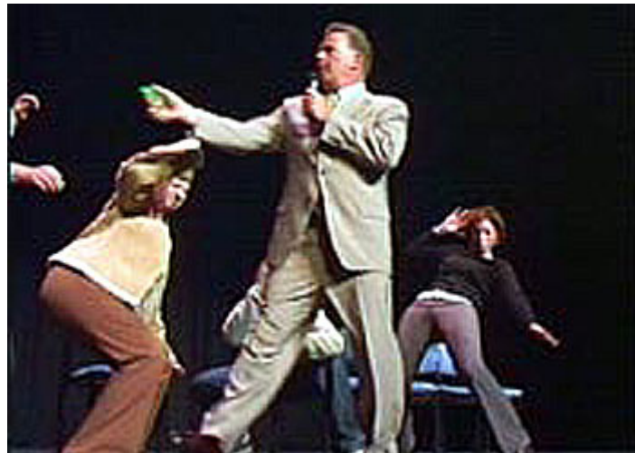
“El famoso hipnotizador Robert Mesmer tumbando a la gente por el piso en su comedy hypnosis show... ¿qué diferencia hay con el anterior?”

¿Ministraban la “ unción de la risa”, y todos a su alrededor incluido Él o ellos, se retorcían de risa incontrolada sin motivo alguno de forma absolutamente grotesca? No.