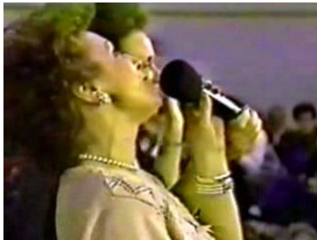
“Aullando como un lobo para “cristo” ”

También podemos añadir otras acciones y herejías, como la “ doctrina de los pequeños cristos ”, “ doctrina de pactos (materialismo) ”, “ dualismo ”, “ activación de ángeles G12 ”, “ imposición directa de manos en las partes genitales para echar fuera demonios lujuriosos ”, “ gritar todos a una creyendo que así salen los demonios (G12) ”; “ espíritu de la Visión (G12) ”, “ Encuentros del G12 ”, “ regresiones ”, “ visualizaciones ”; “ psicodramas ”, “ hipnosis en masa ”, “ guía exclusiva por sueños y visiones ”, “ salidas del cuerpo (proyección astral) ”; “ levitaciones (levantarse del suelo) ”, y otras muchas indecencias espirituales (cada vez surgen más). En el contexto del G12 y sus Encuentros, llaman a todo esto “ experiencias espirituales personales ”, y así lo justifican.